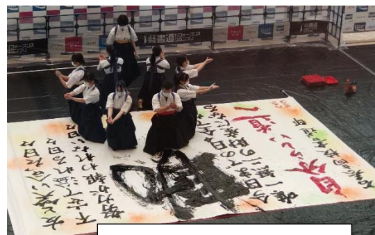
書道部・パフォーマンスグランプリ