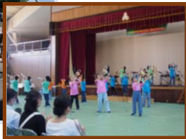
(吹奏楽部の演奏の様子)