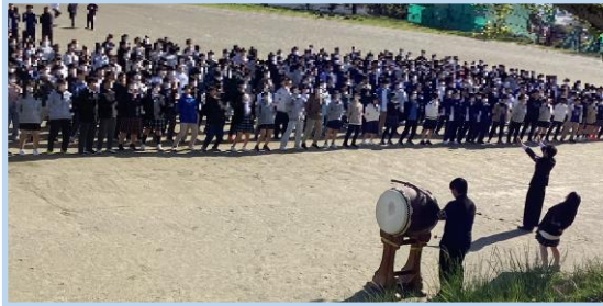
(中庭での応援練習の様子)

校歌、生徒心得綱領、エール等を覚えることによって、石高生としての伝統と誇りを継承するとともに、石高への帰属意識を涵養します。