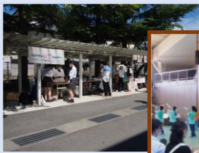
(模擬店販売の様子)

令和5年度のテーマは、「努力・未来・ASEKIKO STAR～鰯陵祭 つづけたら 死んでもいいぜ!～」でした。中止されていた模擬店が何年かぶりに復活し、運営にとまどいもありながらも、来校された皆さんは楽しんでいました。校舎内では、学芸部の研究発表、作品展示等が行われました。